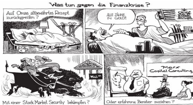
Abbildung 2: 2.10.2008